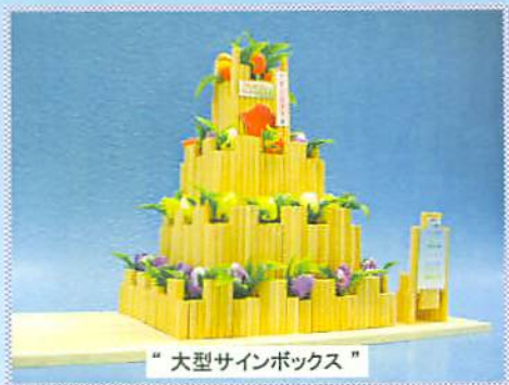
“大型サインボックス”