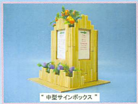
“中型サインボックス”