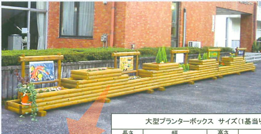
大型プランターボックス サイズ(1基当り)