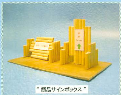
“簡易サインボックス”

周辺景観との調和と人々の目に優しい “間伐材・花・サイン” 三位一体融合 公園施設、イベント会場、道路、歩道等に!!