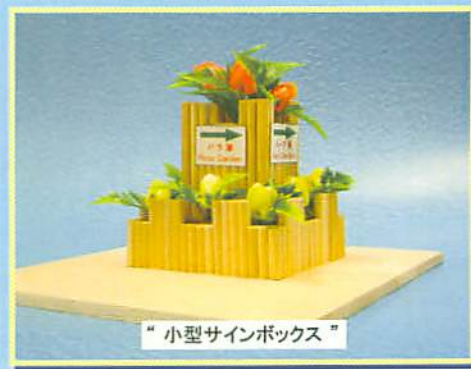
“小型サインボックス”