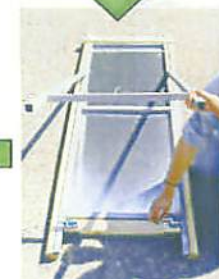
スチール看板を差し込む