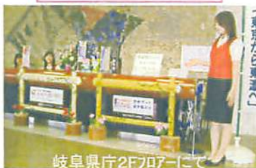
岐阜県庁2F7日アーにて