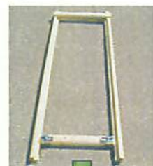
ウッドアーマーを置く