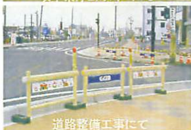
道路整備工事にて